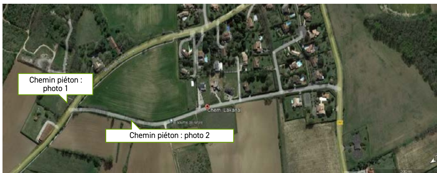
1/ Chemin le long du RD vers Chemin de Lassave

> il y aussi le cas du petit tronçon situé sur le délaissé du haut de la route des coteaux, cet aménagement est lié à l'ouverture à la construction, ou non, de la zone du Cazal2, la tendance sera plutôt non et dans ce cas l'aménagement sera à prévoir.