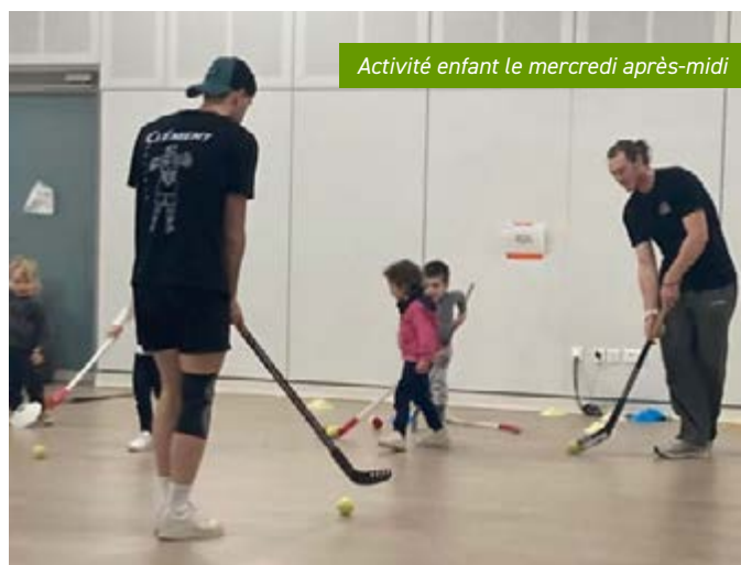
Activité enfant le mercredi après-midi