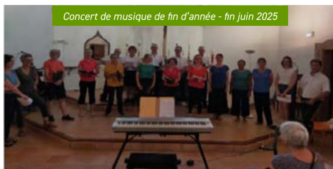
Concert de musique de fin d'année - fin juin 2025

Enfin, n'oubliez pas, notre principal atout de durabilité et de communication c'est vous !